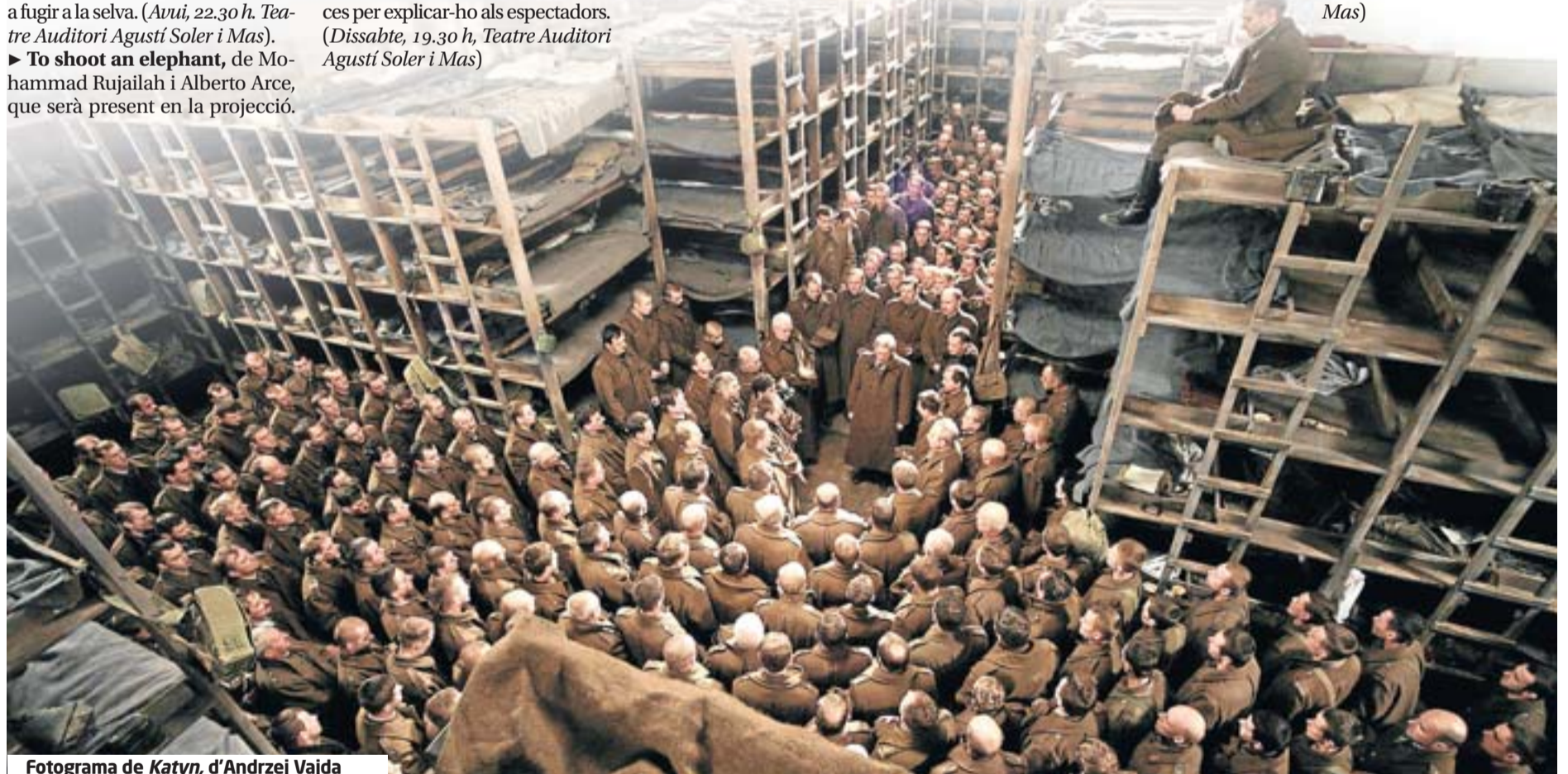
Fotograma de Katyn , d'Andrzej Vajda

► Katyn , d'Andrzej Vajda. Ningú no pot negar a Vajda que és un dels cineastes europeus determinants del segle passat, amb uns títols clàssics com El hombre de mármol i Cenizas y diamantes . El cèlebre director polonès, però, encara continua en plena forma, tal com ho demostra aquesta pel·lícula que fa un parell d'anys va ser nominada a l'Oscar de millor film de parla estrangera i que exposa l'assassinat de 20.000 soldats polonesos per ordre de Stalin. Es tracta d'una gran producció de qualitat per acomiadar-se del CLAM fins a la setmana vinent. (Diumenge, 21.30 h, Teatre Auditori Agustí Soler i Mas)