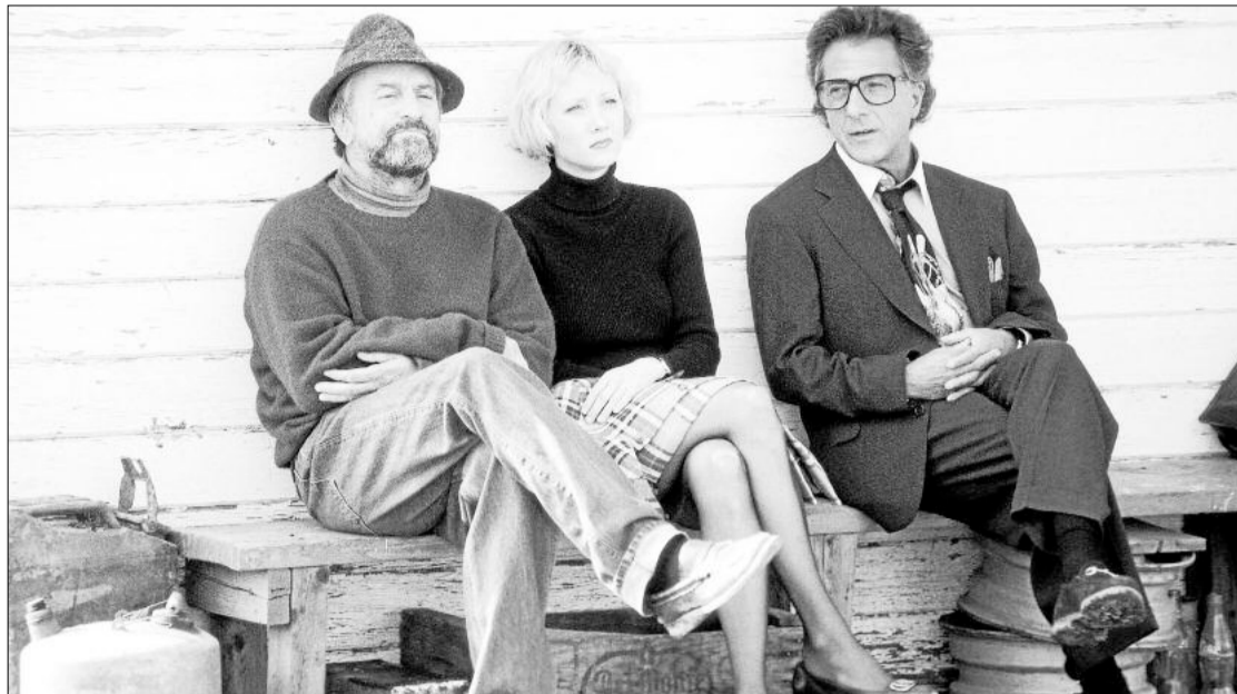
Robert de Niro, Anne Heche i Dustin Hoffman, d'esquerra a dreta, protagonistes de La cortina de humo