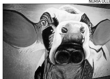
Un dels quadres de la mostra

L'Espai d'Art de Berga acull des d'avui fins al 20 de febrer una exposició d'homenatge a la capacitat pictòrica de Núria Ollé, que va néixer el 1933 a Manresa i va morir el 2009 a la capital berguedana. La mostra exhibeix per primer cop l'obra d'una autora que sempre va pintar per al propi gaudi i no havia ensenyat els seus quadres en públic. La inauguració tindrà lloc a les 8 del vespre.