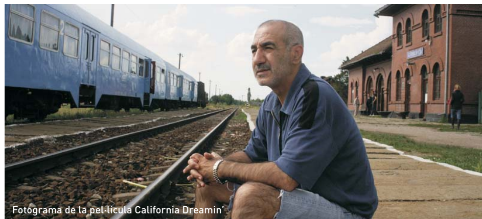
Fotograma de la pel·lícula California Dreamin'

Estiu de 1999, la guerra de Kosovo viu els seus últims episodis. Un tren que transporta equipament de l'OTAN i personal militar americà travessa Romania camí de la frontera sèrbia. El tren s'atura en un poble insignificant on el corrupte cap d'estació no deixarà que els militars segueixin el camí si no aporten una absurda documentació. Obra pòstuma d'un cineasta brillant, que suposa una mirada crítica a la Romania postCeaulescu. Premi "un certain regard" festival de Cannes 2007.